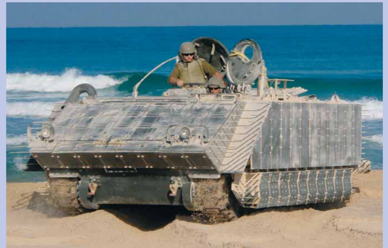
Transporte Blindado de Personal (APC) Altamente Protegido y con Mejores Rendimientos

Calle Lev Pesah, Zona Industrial Norte, Lod 71293, P. O. Box 768, Lod 71106, Israel